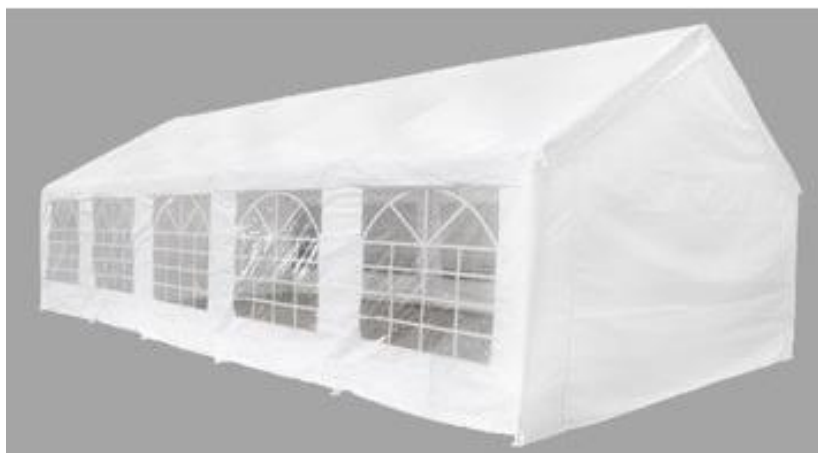
Obr. 3: Párty stan