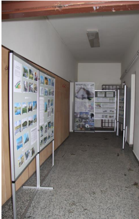
Obr. 4: Výstavní panely