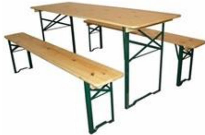
Obr. 5: Pivní set