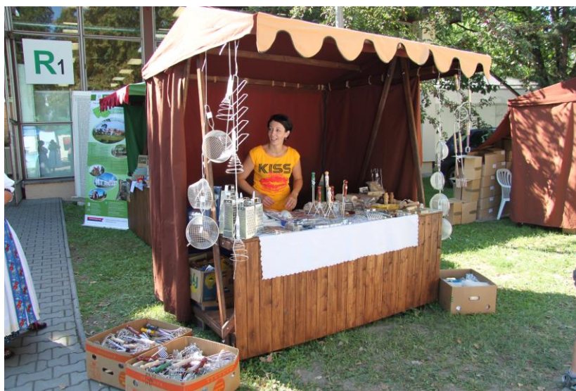
Obr. 2: Prodejní stánek